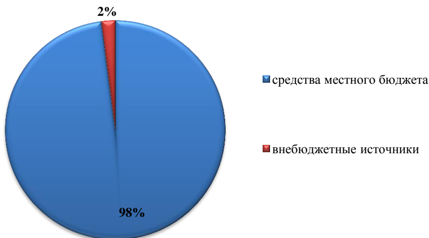
Диаграмма 43. Источники формирования бюджета МБУ ДО ЦПиСПСУ АР в 2019-20 уч. году